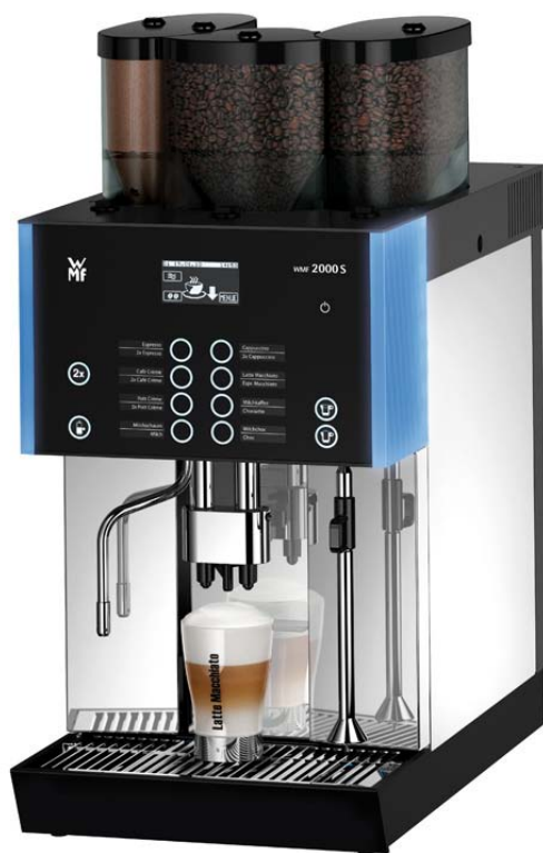
WMF 2000 S